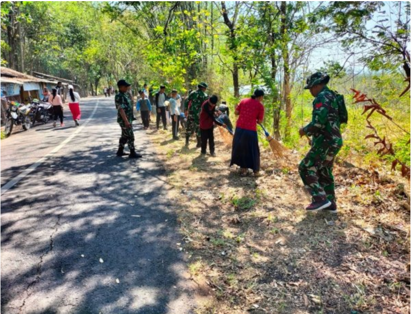
Jajaran Brigif 16 WY Bersama Warga Bersihkan Jalan dan saluran irigasi

KEDIRI - Brigif 16/Wira Yudha Kediri menggelar program Karya Bakti TNI Satnon Kowil semester II TA 2024, dengan sasaran pembersihan jalan dan irigasi (selokan). Karya Bakti juga sekaligus melakukan penyuluhan tentang Wawasan Kebangsaan yang bertempat di Kelurahan Sukorame, Mojojoto, Kota Kediri, pada Rabu (16/10/2024).