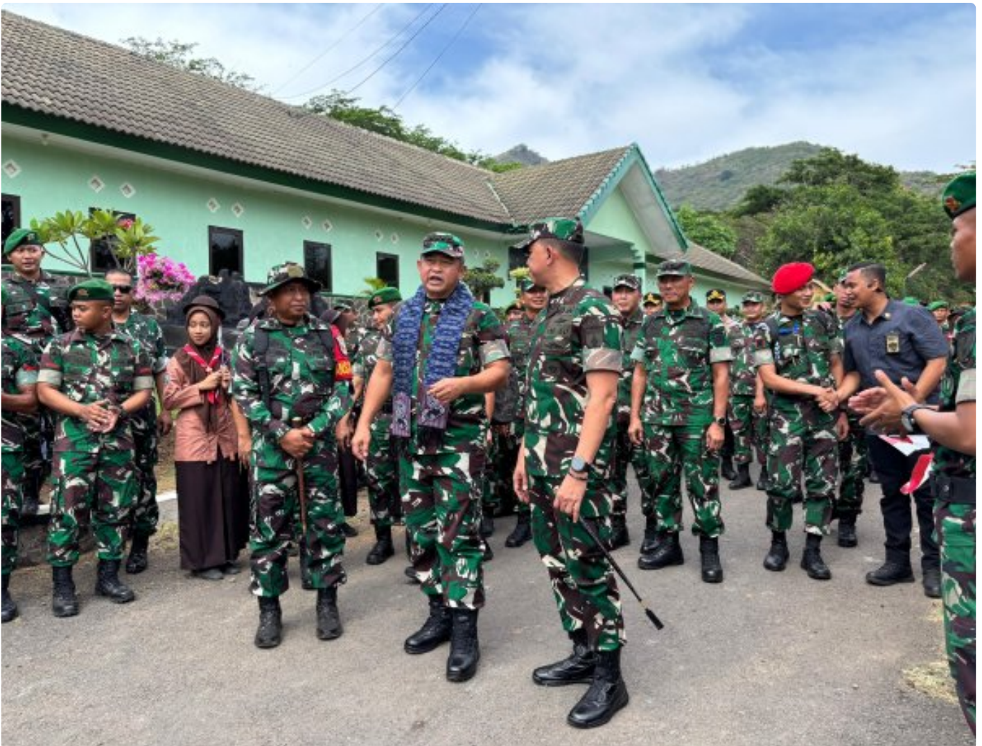
Penyambutan Kasad di Brigif Mekanis 16 Wira Yudha